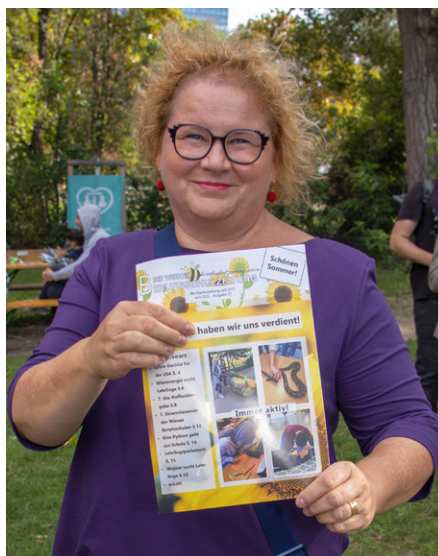
Präsidentin des Bundesrates Korinna Schumann

Schumann hebt in diesem Zusammenhang die hervorragenden öffentlichen Strukturen und Leistungen ihrer Heimat-