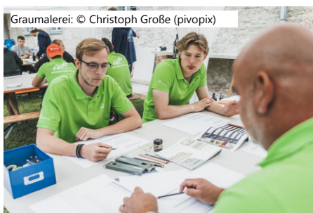
Graumalerei