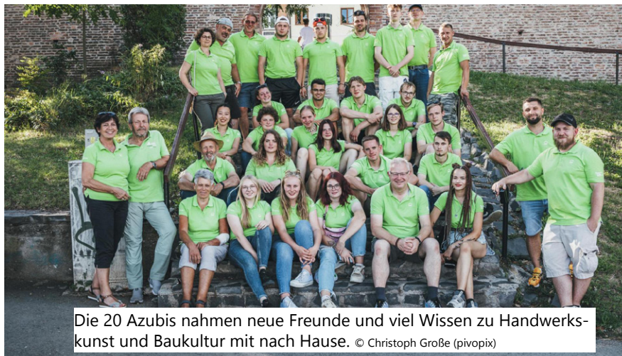
Die 20 Azubis nahmen neue Freunde und viel Wissen zu Handwerkskunst und Baukultur mit nach Hause.